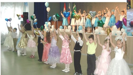
На фото: выступления дошколят.