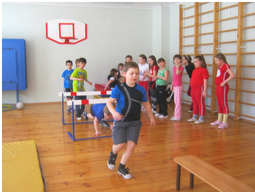
На фотографиях: уроки физкультуры в начальной школе, выступления агитбригады о здоровом питании.

Учащиеся начальной школы активно и с удовольствием принимают участие во всех мероприятиях, проводимых в школе. Они же самые энергичные посетители спортивных секций и кружков. Кроме того, пропаганда здорового образа жизни осуществляется и на уроках физической культуры, проводимых в бассейне. В содержании программы по ОБЖ заложены темы о ЗОЖ.